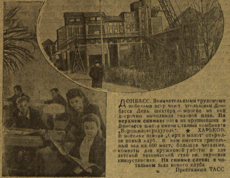
ДОНБАСС. Замечательными трудовыми победами встретят угольщики Донбасса День шахтера — многие из них досрочно выполнили годовую планку. На верхнем снимке: оля в из крупнейших в Донбассе шахт имени Сталина комбината «Ворошиловградуголь». * ХАРЬКОВ. В поселке завода «Серп и молот» открылся новый клуб. В нем имеется эрительный зал на 600 мест, большая читальня, комнаты для кружковой работы и для детской технической стан и звуковая киноустановка. На снимке слева: в читальном зале нового клуба